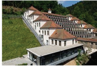
Auf den Spuren von Max Bills Uhren 09 Junghans Terrassenbau Museum in Schramberg Phillipp Jakob Manz + Atelier Brückner