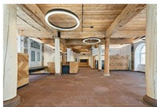
Dem Geist des Ortes nachgespürt 15 Rathaus in Löffingen gäbele&rauffer