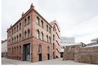
Roter Beton und roter Sandstein 02 Stadtmuseum in Lahr Heneghan Peng