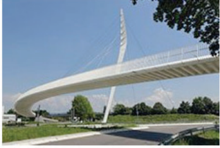
Elegant übers Getöse 01 Fußgängerbrücke in Lahr Henchion Reuter Architekten