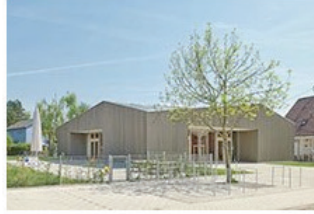
Quadratisch. Praktisch. Gott. 03 Evangelisches Gemeindezentrum in Herbolzheim KUHND UND LEHMANN ARCHITEKTEN