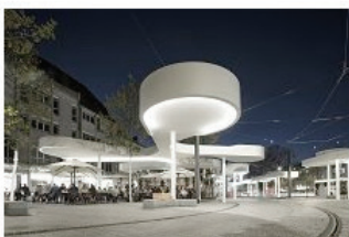
Schöner warten 14 Pavillon am Europaplatz in Freiburg Jürgen Mayer H