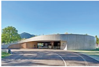
Intelligenter Umbau 05 Freibad »s' Bad« in Waldkirch-Kollnau Kauffmann Theilig & Partner