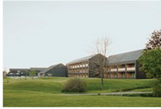
Für gehobene Ansprüche 17 Hotel Öschberghof in Donaueschingen Allmann Sattler Wappner Architekten