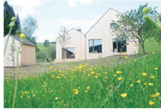
Holzbau mitten im Grünen 18 Ferienhaus am Seilerhansenhof in Furtwangen Kuberczyk Architektur