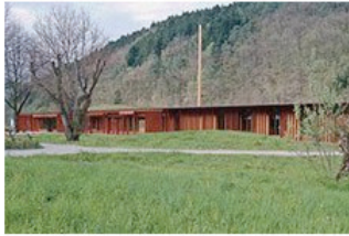
Moderner Holzbau 08 Empfangsgebäude Freilichtmuseum Vogtsbauernhöfe in Gutach Werkgruppe Lahr