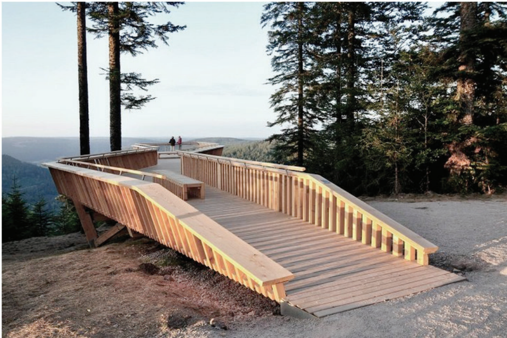
19 Aussichtsplattform Ellbachseeblick in Baiersbronn, Partner und Partner Architekten

Wer einen Urlaub in Deutschland verbringen möchte, sollte einmal über den Schwarzwald nachdenken. Dort gibt es erstklassige moderne Architektur zu entdecken – und übernachten kann man in Hotels von Barkow Leibinger oder Allmann Sattler Wappner.