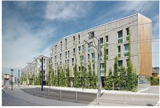
Ökologisch ambitioniert 16 Green City Hotel in Freiburg Barkow Leibinger Architekten