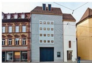
Bauen im Kontext 12 Augustinermuseum in Freiburg Christoph Mäckler Architekten