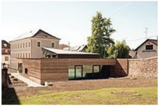
Gestampft 04 Katholisches Gemeindehaus in Herbolzheim K9 architekten