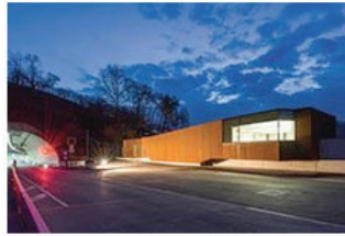
Neuer Typus 06 Tunnelbetriebsgebäude in Waldkirch Hochbauamt Freiburg