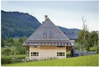
Tradition neu interpretiert 07 Herrenjörgenhof in Elzach-Prechtal Schindler Architekten