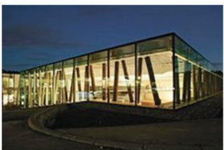
Markante Transparenz 10 Produktionshalle in Waldachtal Schmelzle + Partner